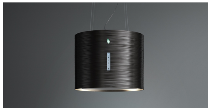
Poglądowe zdjęcie produktu Zdjęcie może dokładnie nie odpowiadać wybranej wersji